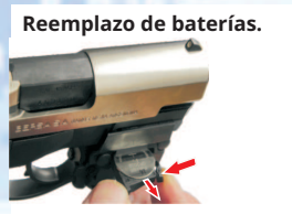
Reemplazo de baterías.

Para regular el dispositivo de puntería láser en el eje horizontal (deriva) se debe ajustar ó desajustar el tornillo de regulación.